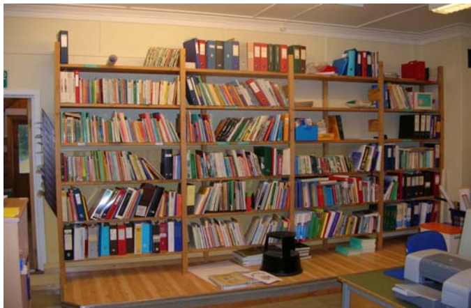
Frå arbeidsrommet til lærarane

Denne prosessen har vore god mellom skule og dei eksterne vurderarane.